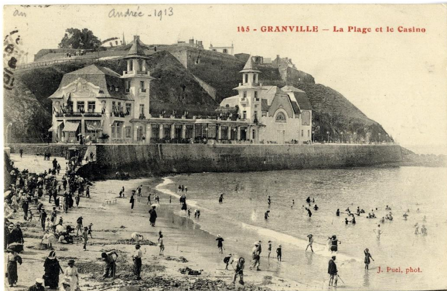
Carte postale issue du fonds du Musée d'art et d'histoire de Granville représentant la plage du Plat Gousset et le casino. Datée entre 1911 et 1913.